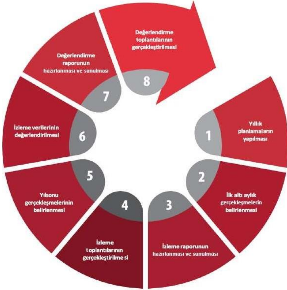
Şekil: İzleme ve Değerlendirme Süreci

İzleme ve değerlendirme sürecinin işleyişi ana hatları ile aşağıdaki şekilde özetlenmiştir: 2024–2028 Stratejik Planı'nda yer alan performans göstergelerinin gerçekleşme durumlarının tespiti yılda iki kez yapılacaktır . Ara izleme olarak nitelendirilebilecek yılın ilk altı aylık dönemini kapsayan birinci izleme kapsamında tüm amaç sorumluları, sorumlu oldukları göstergelerle ilgili gerçekleşme durumlarına ilişkin veriler “Stratejik Plan Sorumlu Müdür Yardımcısı” tarafından toplanarak performans hedeflerinin gerçekleşme durumları hakkında hazırlanan “Stratejik Plan İzleme Değerlendirme Raporu” okul müdürüne sunularak paydaşlarla paylaşılacaktır. Bu aşamada amaç; varsa öncelikle yıllık hedefler olmak üzere, hedeflere ulaşılmasının önündeki engelleri ve riskleri belirlemek ve yıllık hedeflere ulaşılmasını sağlamak üzere gerekli görülebilecek tedbirlerin alınmasıdır.